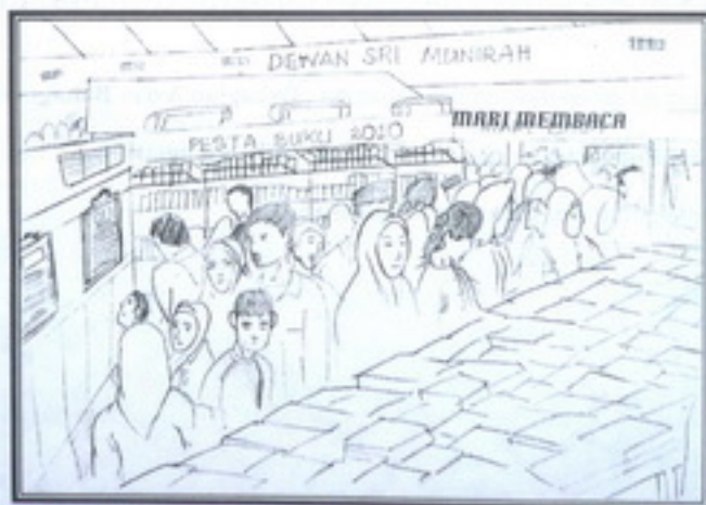
Mengadakan Pesta Buku