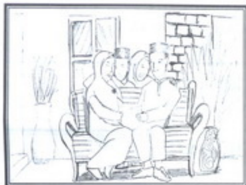
Ibu Bapa Menjadi Suri Teladan

Gambar rajah di bawah menunjukkan langkah-langkah untuk membudayakan amalan membaca dalam kalangan rakyat Malaysia. Huraikan pendapat anda tentang langkah-langkah membudayakan amalan tersebut dalam kalangan masyarakat. Panjangnya huraian hendaklah antara 200 hingga 250 patah perkataan.