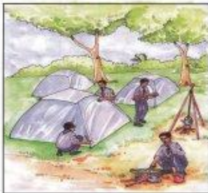
Semangat Kerjasama dan Pembentukan Disiplin