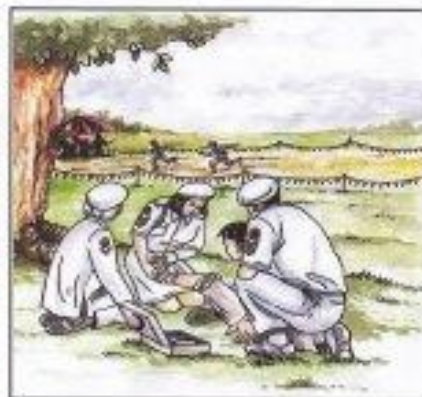
Pengetahuan Asas Bantuan Kecemasan